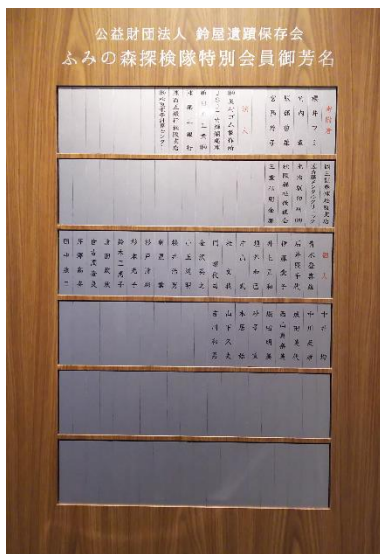
ふみの森探検隊特別会員御芳名