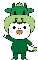
松阪市マスコットキャラクター 「ちやちやも」