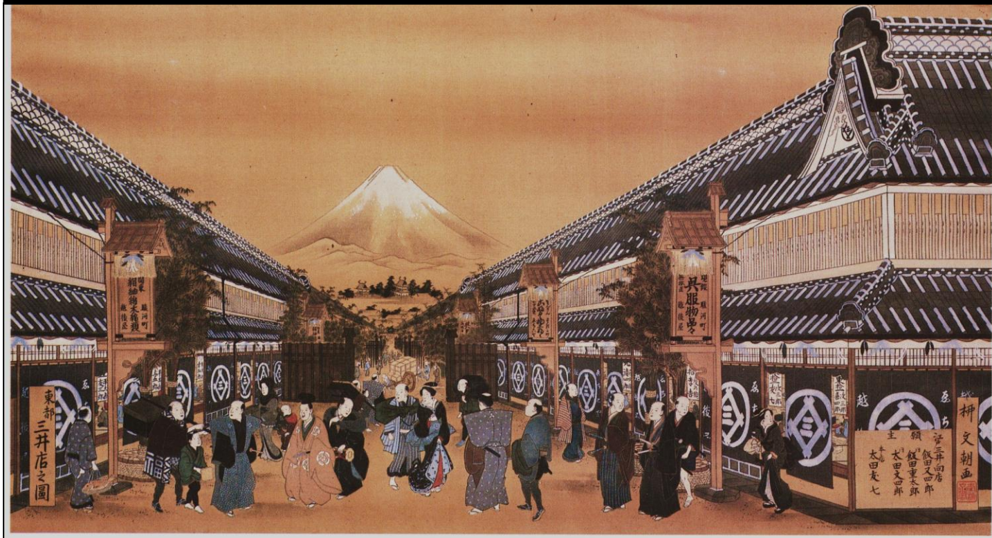
「東都三井店之図」

松阪の木綿商人の家に生まれ、国学の祖といわれる「本居宣長」の思想や倫理観には、現代経営者が学ぶべき視点が多い。さらに、三井財閥の始祖である三井高利をはじめ、近世、江戸日本橋界隈で豪商として名を馳せた多くの「松阪商人」を輩出した松阪の「まち」には、現代のビジネスにもつながる「商人道」や「りりしき」を育んだ風土・文化がある。その優れたアイデンティティを現代に受け継ぐ企業の活動拠点「東京日本橋」で、彼らの素顔や才覚にふれ、経営、牛・お茶・野菜など豊富な松阪の食、女性たちの活躍した木綿を五感で感じる「経営文化セミナー」。参加をお待ちしています。